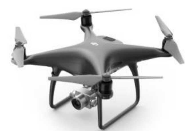
Exemple de services faible latence envisagés: Industrie connectée, Cloud Gaming, Pilotage de drones et Véhicules Autonomes